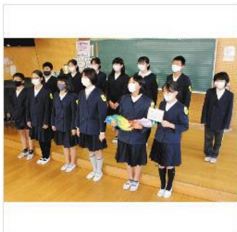
医療関係者へのメッセージ動画を収録する「感謝活動」プロジェクトのメンバー＝袋井市袋井北小で