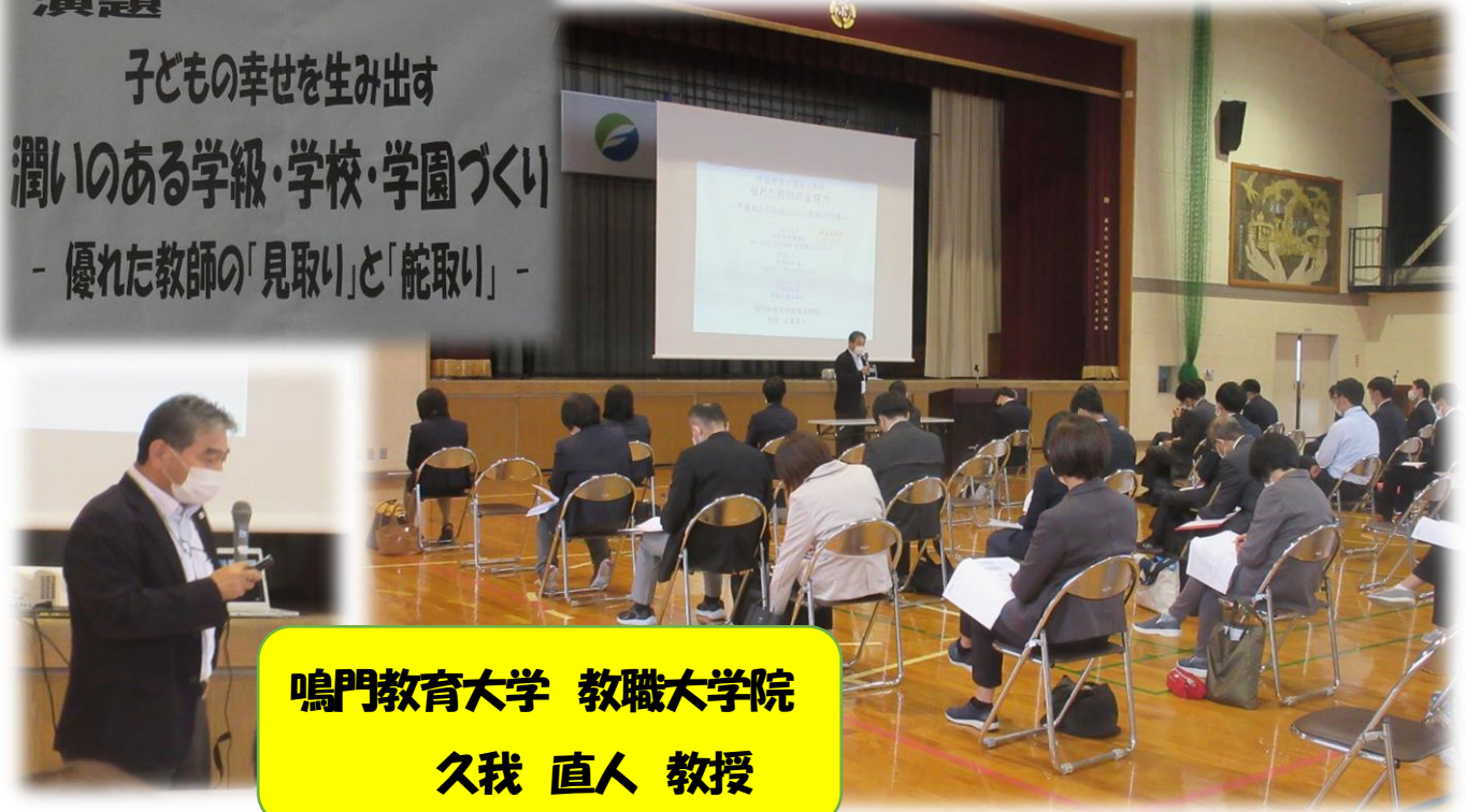
鳴門教育大学 教職大学院 久我 直人 教授

子どもの幸せを生み出す 潤いのある学級・学校・学園づくり - 優れた教師の「見取り」と「舵取り」 -