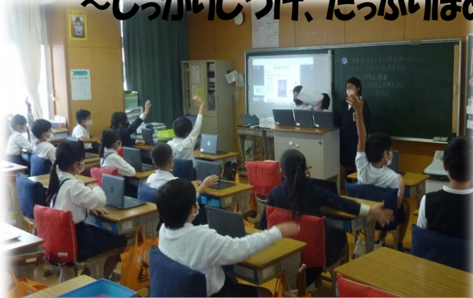
児童の思いを大切にした授業展開