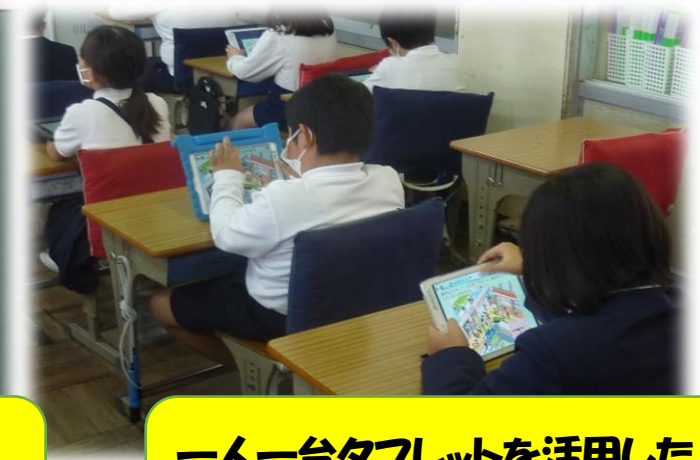
一人一台タブレットを活用した 個別最適な学び

11月1日(火)袋井北小学校にて、第4回袋井あやぐも学園幼小中一貫教育研修会が行われました。袋井北小学校の授業を参観させていただき、幼・小・中それぞれの立場から、 共通して取り組んでいることを確認したり、幼小の接続・小中の接続のイメージを再認識したり するなど、令和4年度の「袋井あやぐも学園・真化の取組」として、学園職員が 確かな手応え を得た研修会となりました。